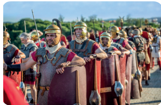
Entrada de las tropas romanas