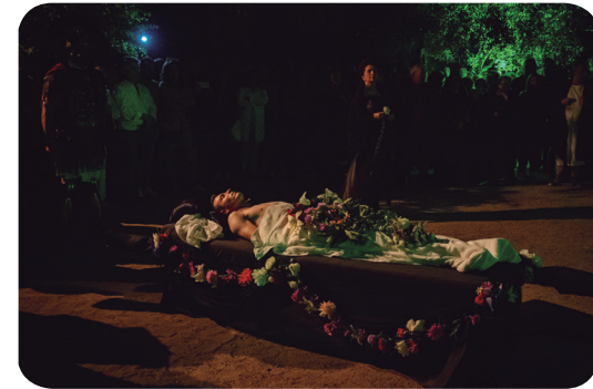
Funeral de un ciudadano romano

Representación en la Casa del Mitreo y Columbarios de Fvns Romanvm . Un Funeral de un Ciudadano Romano, para conocer las costumbres romanas en torno a la muerte.