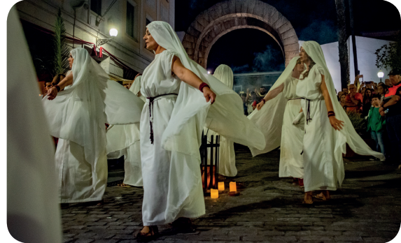
Danza del fuego sagrado

Estas sacerdotisas debían mantener encendido el fuego sagrado.