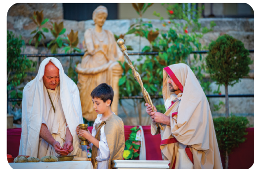
Precatio a la Diosa Diana

Ofrenda de vino a la Diosa Diana, en el Templo de Diana.