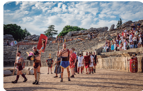
Lucha de gladiadores