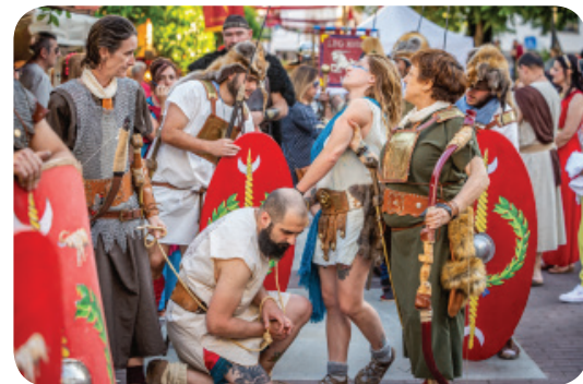
Venta de esclavos

Representación de un desfile de esclavos para su venta en el Foro. El desfile pasará por la Plaza de la Constitución, Arco de Trajano, Templo de Diana, Sagasta, José Ramón Mélida, Plaza Margarita Xirgú y por el Anfiteatro Romano.